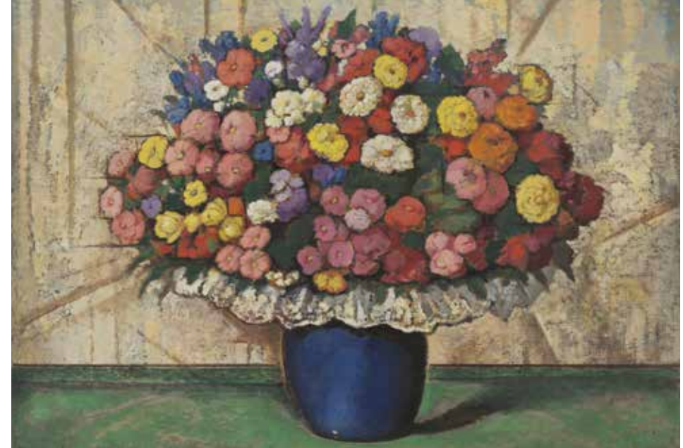
Jarrón azul de flores (Blue Vase of Flowers) (detail), ca. 1935. Oil on cardboard / óleo sobre papel cartón. SBMA, Gift of the P.D. McMillan Land Company.

from the Collection of the Santa Barbara Museum of Art